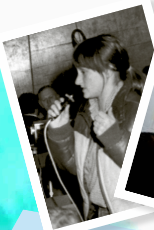
Anfang der 80er Jahre bei einer Bürgerversammlung

Katholische Jugendverbandsarbeit prägt viele junge Menschen für das spätere Leben und die Mitgestaltung von Gesellschaft und Politik