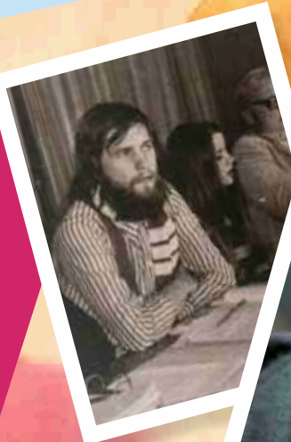
1972 bei einer KSJ-Versammlung

Die KSJ hatte prägenden Einfluss auf mich. So vieles habe ich hier gelernt – akzentuiert vorzutragen etwa, gemeinsam Lieder zu singen, Zelte auf- und abzubauen, in einer Gruppe Projekte zu verfolgen, Versammlungen zu leiten und natürlich Strategie und Taktik. Ich wurde politisch aufgeklärt, erfuhr, dass es außer der CDU noch andere Parteien gibt, öffnete mich politisch. Und noch heute wirken die damals geknüpften Bande.