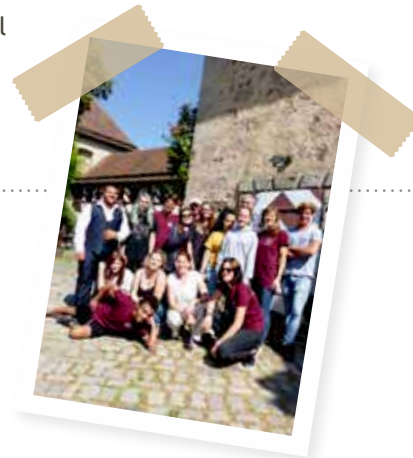
Der bayerische Landesheimrat vertritt die Interessen von Heimkindern.

Mehr Infos: www.landeshheimrat.bayern.de