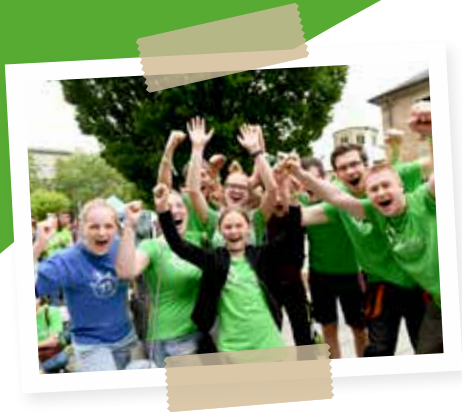
In 72 Stunden die Welt ein Stückchen besser machen