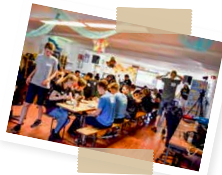
„Jugend hackt“ in Halle 2018