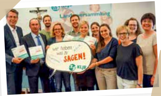
Bayerische Landtagsabgeordnete zu Gast auf der KLJB-Landesversammlung – das Holzschild für das Projekt „Wir haben was zu sagen“ war immer dabei.